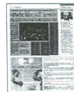
Peso: 1-1%, 13-40%